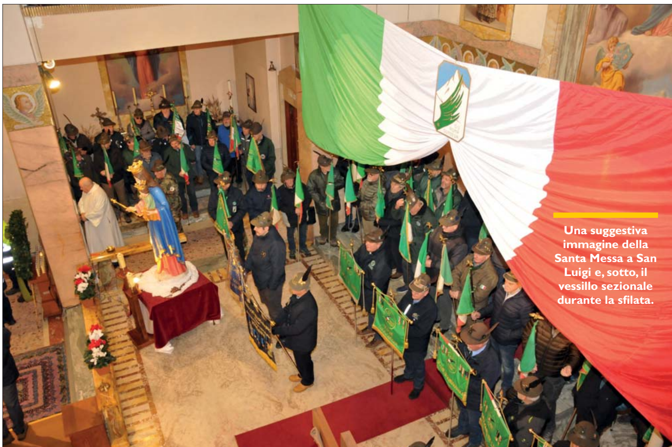
Una suggestiva immagine della Santa Messa a San Luigi e, sotto, il vessillo sezionale durante la sfilata.