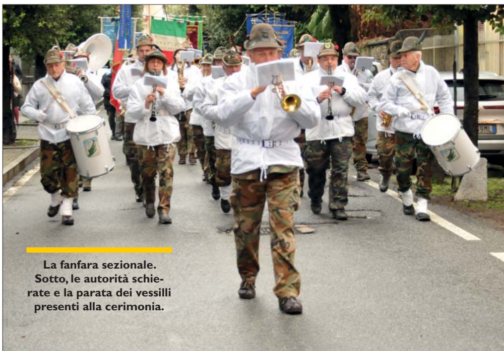
La fanfara sezionale. Sotto, le autorità schierate e la parata dei vessilli presenti alla cerimonia.

La presenza praticamente di tutti i Gruppi, delle Associazioni d'Arma, di moltissimi Sindaci e Autorità della Provincia hanno reso l'evento particolarmente sentito e si-