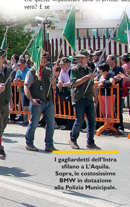
I gagliardetti dell'Intra sfilano a L'Aquila. Sopra, le costosissime BMW in dotazione alla Polizia Municipale.

Scopriamo, infatti, passando per via Roma, circa millequattrocentometri di strada, che non c'è una sola casa ricostruita e nemmeno un residente in tutta la via. Ma allora stanno ricostruendo solo palazzi? Hanno messo i tubi innocenti neri con le borchie di ottone, bellissimi, per sostenere i palazzi. Ma ci dicono che queste impalcature sono in affitto. Sarà vero? E se