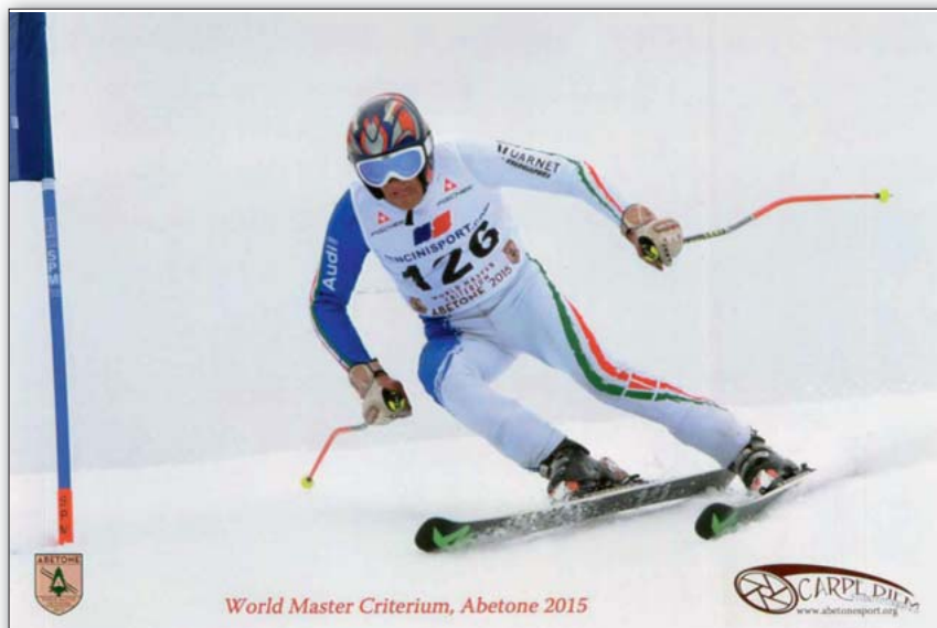
World Master Criterium, Abetone 2015

Al nostro atleta i complimenti del Consiglio Direttivo e di tutti gli Alpini della Sezione per la conquista dell'ambito trofeo.