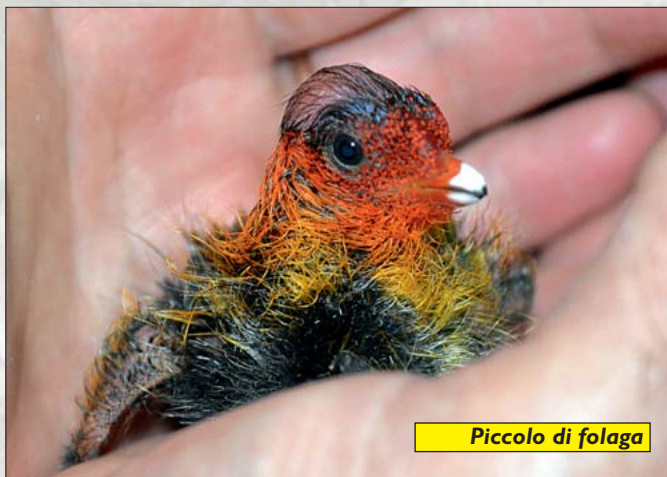
Piccolo di folaga

poter confermarne la presenza. Adesso, grazie alle ricerche della Polizia Provinciale, sappiamo che ce ne sono sicuramente due e si tratta di due maschi che frequentano la stessa zona e sembrano tollerarsi vicendevolmente. Ma l'ultima novità peraltro straordinaria è l'avvistamento ripetuto di una coppia di gipeti in alta Val Strona. Un gipeto è un avvoltoio di grandi dimensioni, maestoso, con una testa molto caratteristica "barbata" con occhi