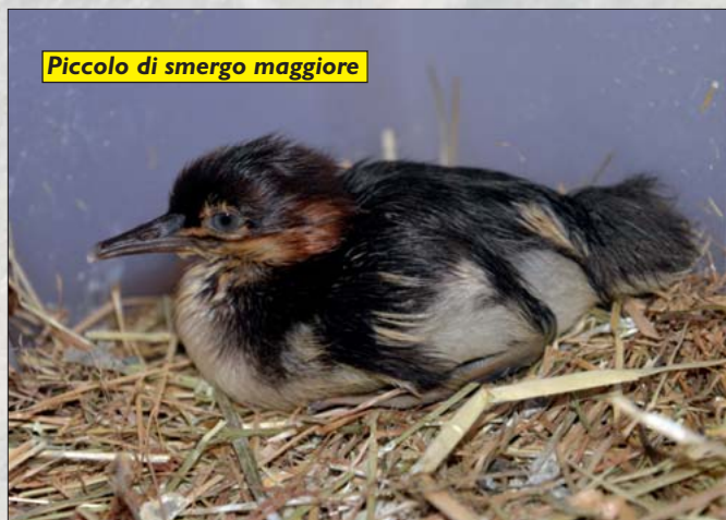
Piccolo di smergo maggiore

Spero di aver dato un'idea di ciò che vorrei trasmettervi nei prossimi numeri, ma per sottolineare e capire l'importanza del nostro territorio devo inevitabilmente produrre qualche dato. Delle circa seicento