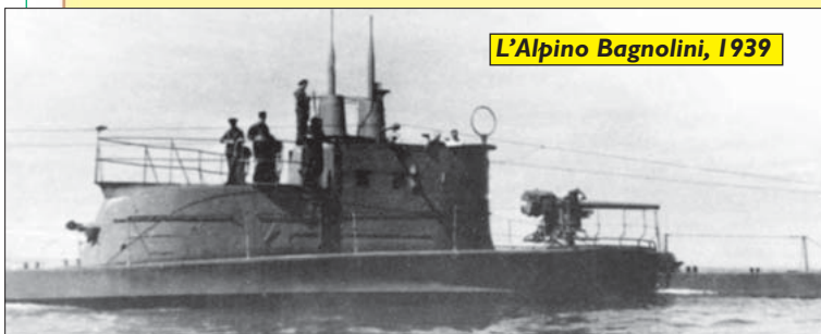
L'Alpino Bagnolini, 1939

Lungo 46 metri e largo 4,75 , il Bagnolini aveva un dislocamento in immersione di 593 tonnellate e poteva raggiungere la profondità di 150 metri (300 al collaudo) spinto da due motori diesel Fiat da 570 CV ciascuno, da un motore elettrico di 900 CV, da due sottobatterie e da un'elica. In immersione poteva raggiungere una velocità superiore ai 14 nodi