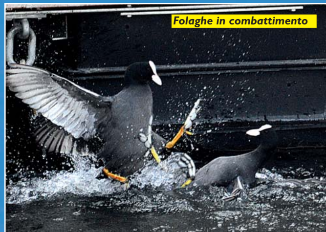
Folaghe in combattimento

Camminando oltre, ancora altri uomini: palazzi e ville d'epoca a dimostrazione di una vivacità imprenditoriale, di una attrazione anche attraverso il paesaggio che nel passato