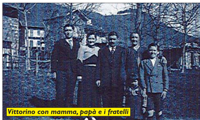
Vittorino con mamma, papà e i fratelli

L'aveva scritta a SV. Mihovili, il 22 febbraio 1942. L'ha sicuramente recitata in ogni momento di difficoltà. E ora può declamarla sereno, insieme ai compagni, nel Paradiso di Cantore.