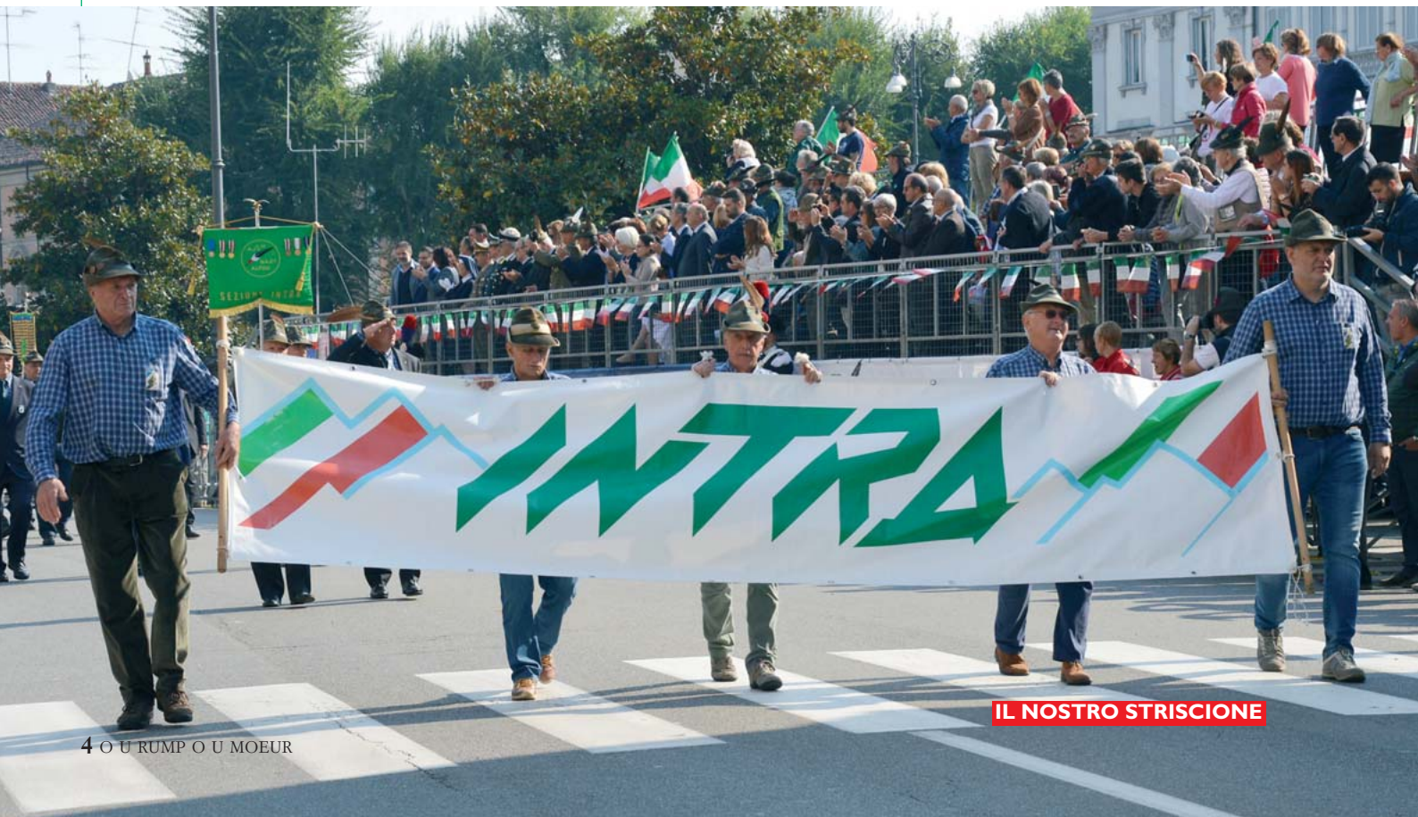
IL NOSTRO STRISCIONE