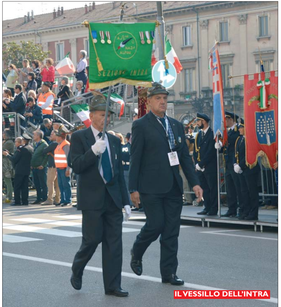
IL VESSILLO DELL'INTRA

Dopo il rituale dell'appello partiamo finalmente alla volta della "Patria del riso", dove arriviamo dopo un piacevole viaggio che, paesaggisticamente parlando e malgrado un po' di leggera nebbia, è comunque tutto da gustare: dal litorale del Lago Maggiore, rigoglioso di vegetazione, alla campagna pie-