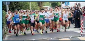
Corsa in montagna, festa tricolore a Verbania