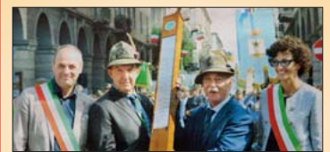
All'Intra la "stecca" del 1° Raggruppamento