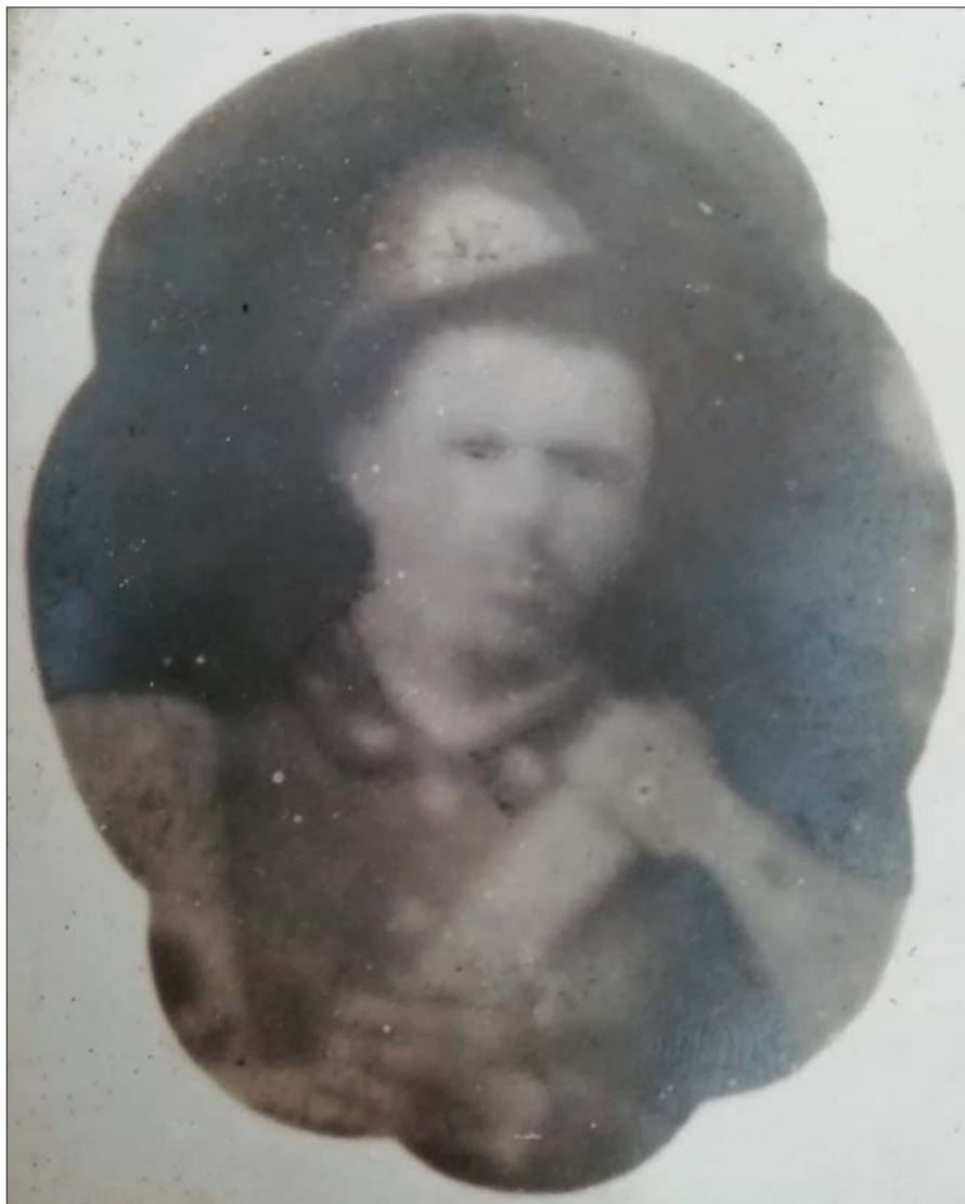
Anonimo Alpino dell'Ottocento, reclutato in uno dei nostri Mandamenti dopo il 1880 come appare dal fregio, probabilmente con incarico di zappatore in quanto dotato di un'ascia.

Il capitano Perrucchetti – ricordato come il "padre" delle truppe alpine, anche se alla loro creazione contribuirono più d'uno e in primis il meno noto tenente colonnello Agostino Ricci che aveva già