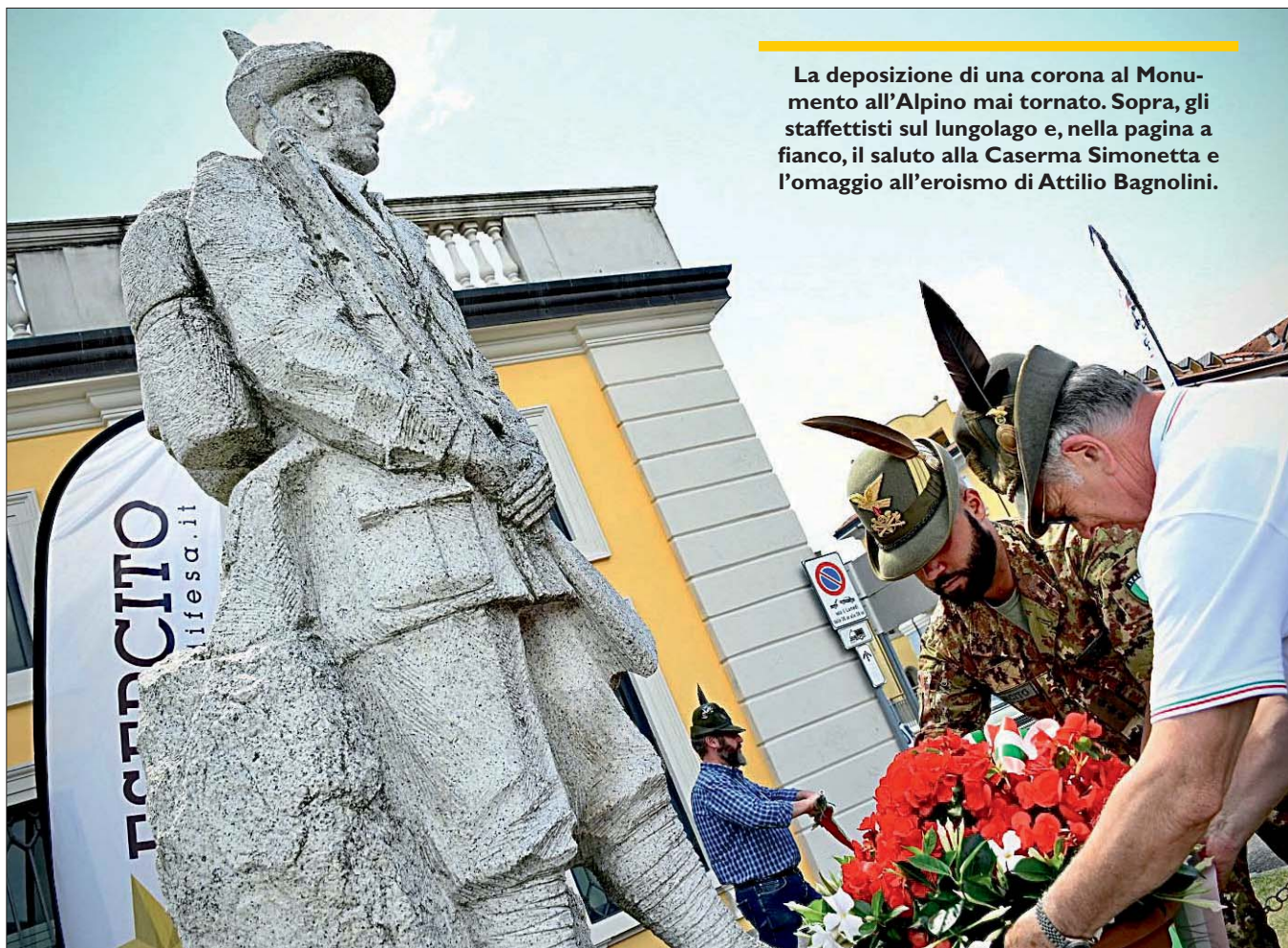
La deposizione di una corona al Monumento all'Alpino mai tornato. Sopra, gli staffettisti sul lungolago e, nella pagina a fianco, il saluto alla Caserma Simonetta e l'omaggio all'eroismo di Attilio Bagnolini.