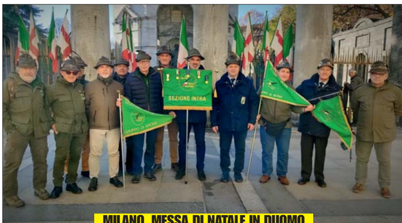
MILANO, MESSA DI NATALE IN DUOMO