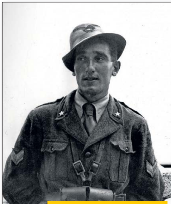
Mario Rigoni Stern, l'autore del famoso Il Sergente nella neve, in una foto del 1941, anno in cui arrivò a Verbania con il Battaglione Val Chiese del 6° Reggimento. Sotto, un'immagine del Val Chiese in terra di Russia.

Tra gli Alpini che soggiornarono a Verbania nell'estate del 1941, c'era anche un giovane sottufficiale che nel dopoguerra sarebbe diventato famoso per un suo libro sulla campagna di Russia, Il sergente nella neve , Mario Rigoni Stern che ricordò quel periodo in alcune pagine de "L'ultima partita a carte" edito nel 2002.