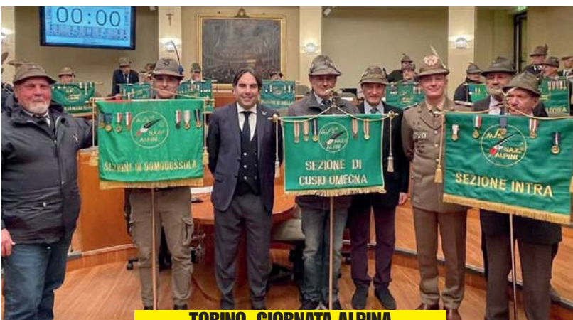
TORINO, GIORNATA ALPINA