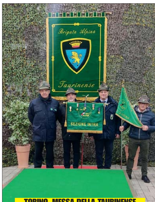
TORINO, MESSA DELLA TAURINENSE