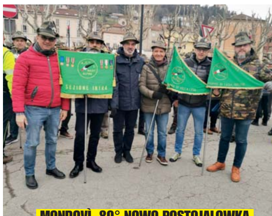
MONDOVI, 80° NOWO POSTOJALOWKA

I l Vessillo della Sezione Intra, accompagnato dai suoi (e nostri) rappresentanti, è sempre in viaggio: come potete leggere ogni volta sul nostro giornale, tanti sono stati gli appuntamenti che vedono la presenza del Vessillo e qui vi proponiamo in rapida carrellata la testimonianza fotografica di alcuni di questi.