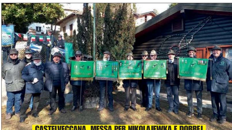
CASTELVECCANA, MESSA PER NIKOLAJEWKA E DOBREJ