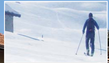
Sport: che spettacolo, l'Intra! p. 17