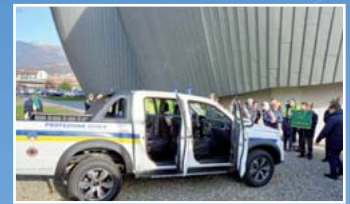
Protezione Civile, il nuovo mezzo p. 16

Si prega cortesemente di restituire al mittente in caso di mancato recapito