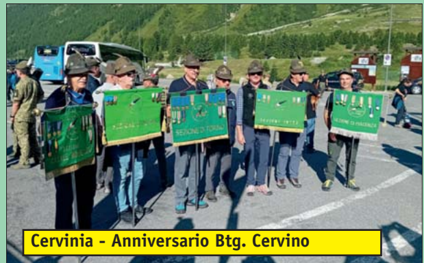
Cervinia - Anniversario Btg. Cervino