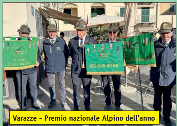
Varazze - Premio nazionale Alpino dell'anno