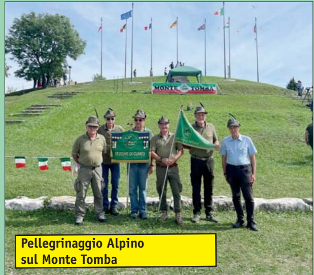
Pellegrinaggio Alpino sul Monte Tomba