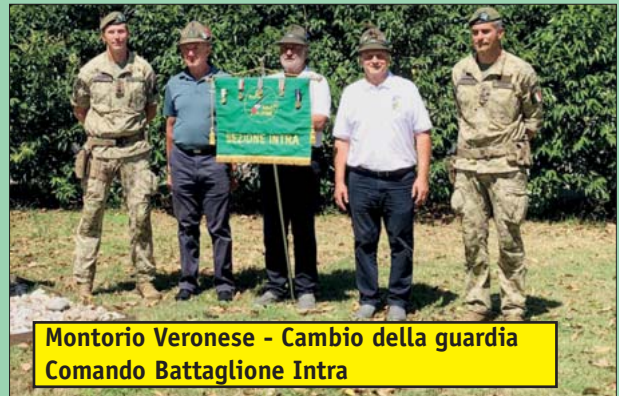
Montorio Veronese - Cambio della guardia Comando Battaglione Intra